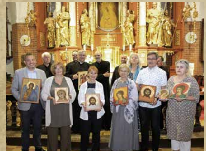
Obrzęd poświęcenia ikon w Ornecie w 2024 r.

Obecnie członkowie Grupy prowadzą bardziej indywidualną działalność w dziedzinie malarstwa ikonowego i dydaktyki ikonograficznej.