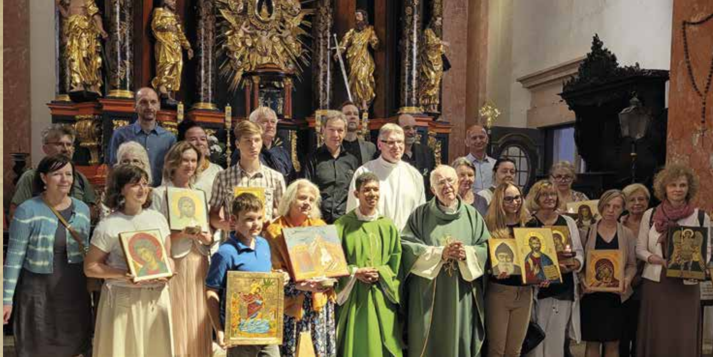
Obrzęd poświęcenia ikon w Krośnie w 2022 r.