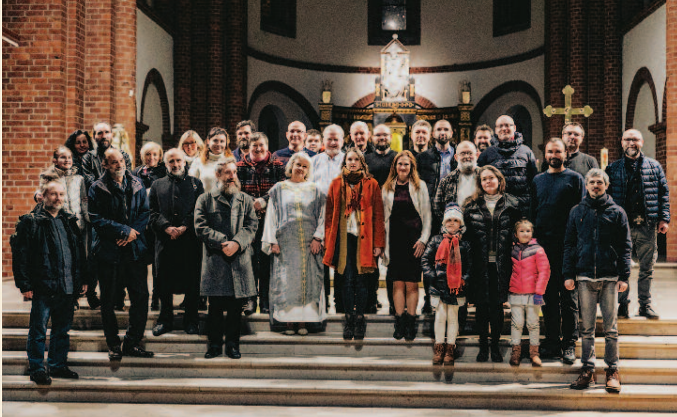
Schola Węgajty po spektaklu Ludus Danielis w Chorzowie, 10 listopada 2021