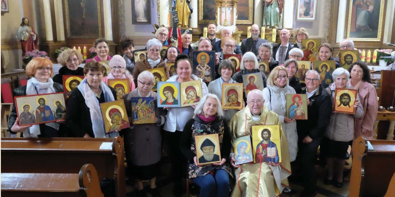
Zdjęcie grupowe z obrzędu poświęcenia ikon w Cerkiewniku, maj 2022