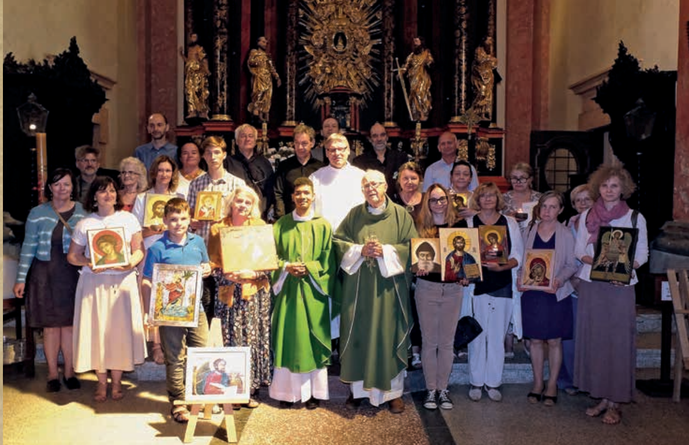
Uroczystość poświęcenia ikon w Sanktuarium w Krośnie w 2022 r